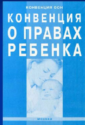
Конвенция о правах ребенка.

В соответствии со ст. 63 Семейного кодекса РФ - Родители имеют право и обязаны воспитывать своих детей. Они обязаны заботиться о здоровье и развитии своих детей. Согласно ч. 1 ст. 18 Конвенции о правах ребенка, родители несут основную ответственность за воспитание и развитие ребенка. Предоставленное право есть личное, неотъемлемое право каждого родителя. Оно заключается в том, что родителю дано право лично воспитывать своих детей. При этом они свободны в выборе способов и методов воспитания.